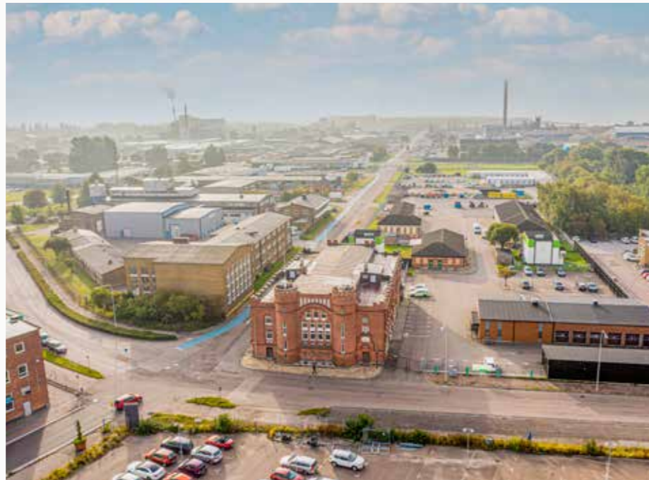
Elverket, vårt huvudkontor i Landskrona

Elnät har fortsatt med stora reinvesteringar i centrala Landskrona med ombyggnation av flera serviser samt 863