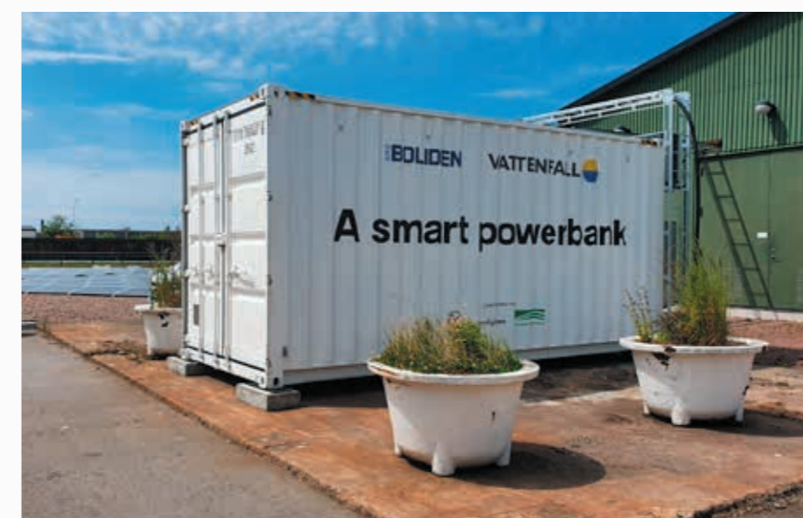
Batterilager på Boliden Bergsöes återvinningsanläggning i Landskrona

är att ett batterilager ska kunna ge kunder, som exempelvis industriföretag, trygg elförsörjning och sänkta elkostnader. Dessutom finns det möjlighet för kunder att sälja tjänster till energi- eller effektmarknaden. Ett annat samarbete för att optimera användandet av vårt elnät och undvika kapacitetsbrist, är det EU-finansierade initiativet CoordiNet, som i Skåne drivs av E.ON med projektet SWITCH. En digital marknadsplats för elnätskapacitet, som bidrar till flexibilitet och gynnar balans i elnätet. Vi har anslutit oss till projektet, då vi ser att vi redan idag behöver arbeta aktivt med alla de lösningar som gynnar nuvarande och framtida kunder.