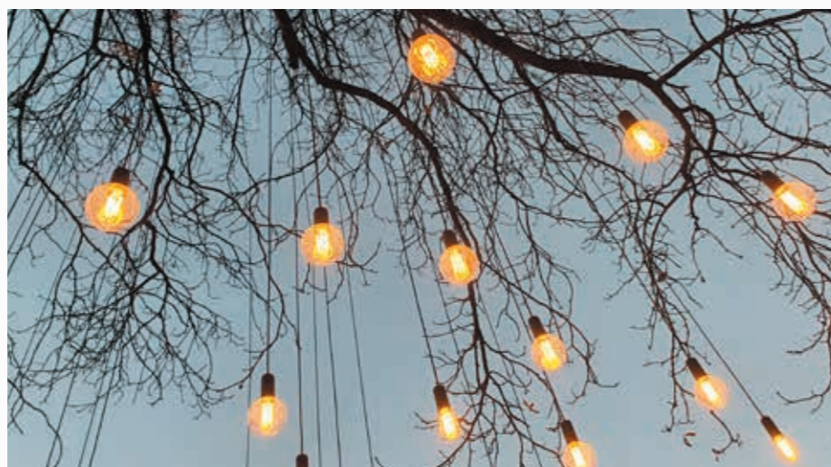
Ljuset i Landskrona

"Ljuset i Landskrona", ljusevenemanget från oktober till januari, som arrangerades av staden i samarbete med oss, blev ett strålande exempel. Stadens utomhusmiljö lyste upp i installationer, utställningar och aktiviteter av 30 konstnärer på 26 olika platser. Ett eve-