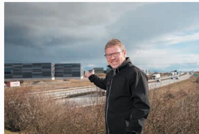
Kronan och Borstahusen växer intensivt och vi är med där det händer

Vi är idag inte påverkade av någon kapacitetsbrist i vårt nätområde, men med batterilagret kan vi vara i framkant och säkra för framtiden. Tanken